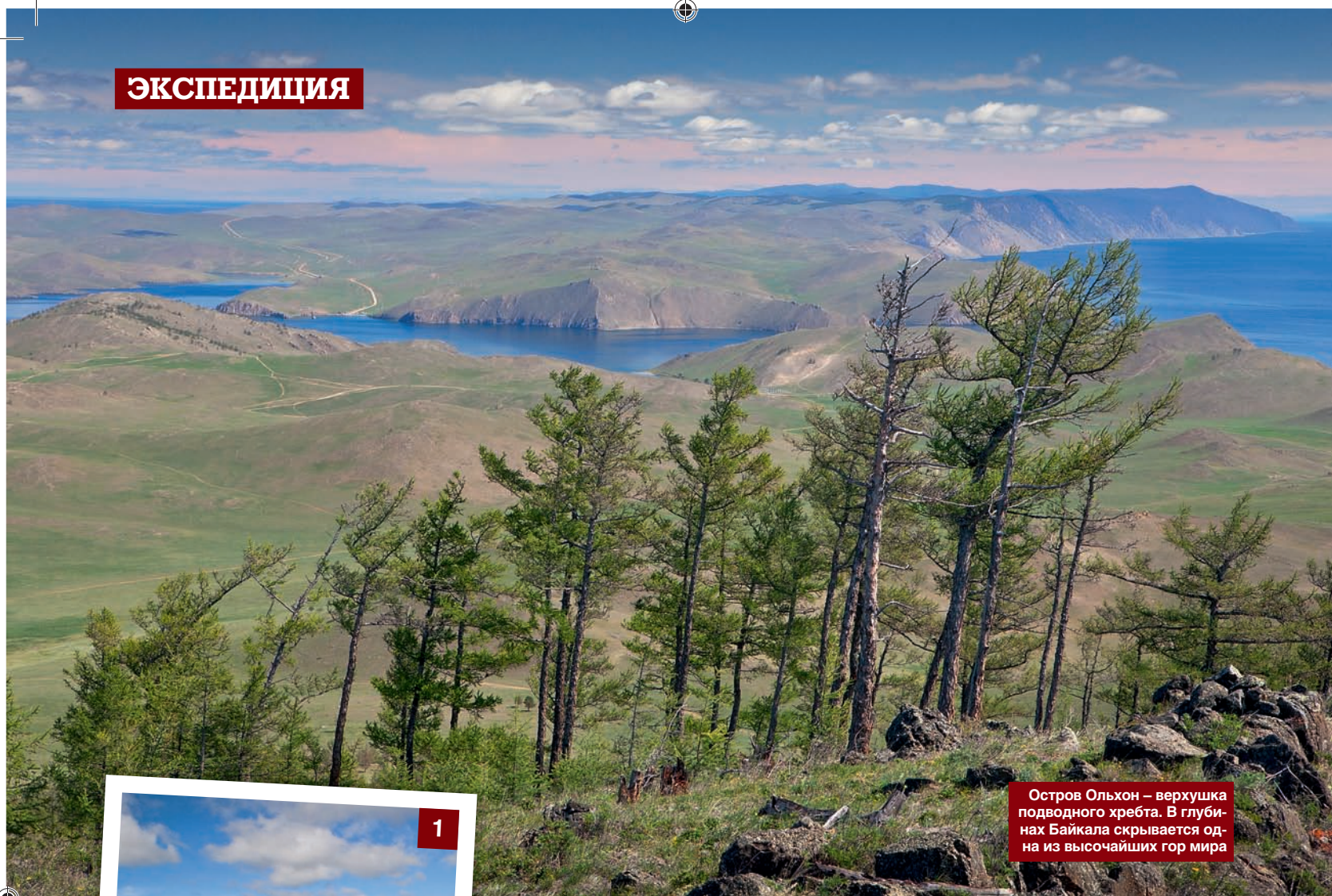
Остров Ольхон – вершушка подводного хребта. В глубинах Байкала скрывается одна из высочайших гор мира